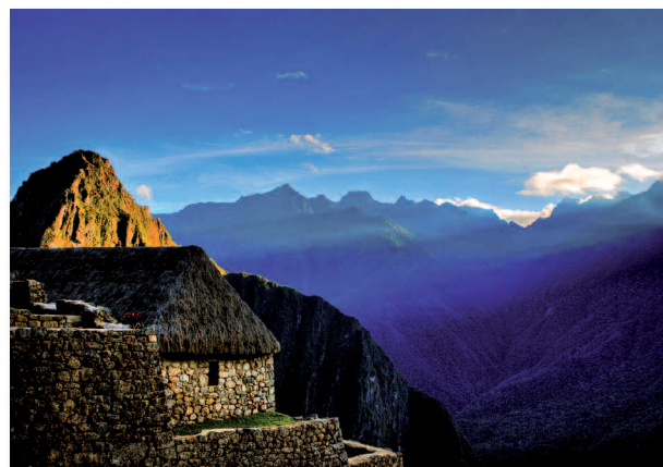
Lever de Soleil sur le Macchu Picchu, Pérou

Ce long temps de pose permet de jouer avec la lumière. Par exemple, l'effet soyeux des mouvements de l'eau sur la fontaine devant le Patuxai ou les formes fantomatiques de deux personnes devant les tours Petronas. Cet effet a été obtenu en demandant aux protagonistes de rester immobiles et de changer de pose toutes les 15 secondes.