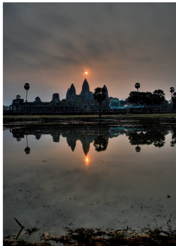
Lever de Soleil sur Angkor Vat, Cambodge

Photographe, c'est modeler la lumière. C'est là où votre créativité doit s'exprimer : tentez de réaliser une photo avec une lumière rasante ou avec le soleil dans l'axe mais dissimulé derrière un arbre. Une photo avec le soleil dans l'axe donnera la plupart du temps une photo surexposée avec de larges zones "brûlées". Une même photo prise au lever du soleil ou au coucher sera différente, avec des éclairages spécifiques.