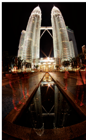
Tours Petronas, avec des personnes en mouvement. Temps de pose de 30 secondes, 100 iso

Ce long temps de pose permet de jouer avec la lumière. Par exemple, l'effet soyeux des mouvements de l'eau sur la fontaine devant le Patuxai ou les formes fantomatiques de deux personnes devant les tours Petronas. Cet effet a été obtenu en demandant aux protagonistes de rester immobiles et de changer de pose toutes les 15 secondes.