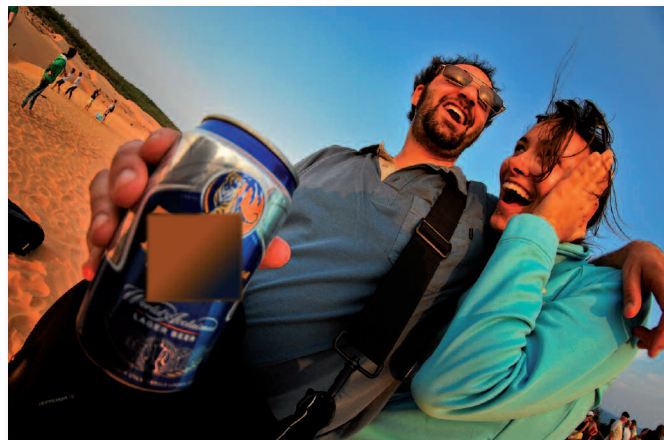
Rires dans les dunes, Mui Ne, Vietnam

J'apprécie la prise de vue avec l'appareil photo à hauteur de taille, en marchant : les photos ainsi faites peuvent être très originales et changent de l'ordinaire d'un sujet qui pose.