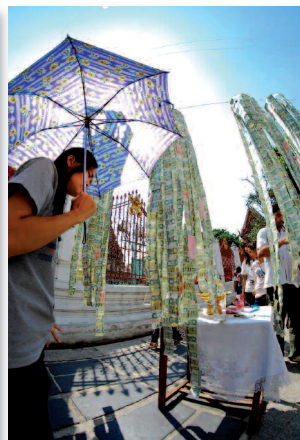
Passante à l'ombrelle au Vat Arun, Bangkok, Thaïlande

Dans ce cas, pas le temps de faire la mise au point et la technique d'"hyperfocale" permet d'avoir une image avec une grande profondeur de champ et de ne pas avoir à faire de mise au point avant de prendre une photo. Elle permet de calculer la distance à laquelle prendre une photo pour que tout soit net de la moitié de cette distance à l'infini. Ceci permet de faire des photos "à la volée" sans mise au point.